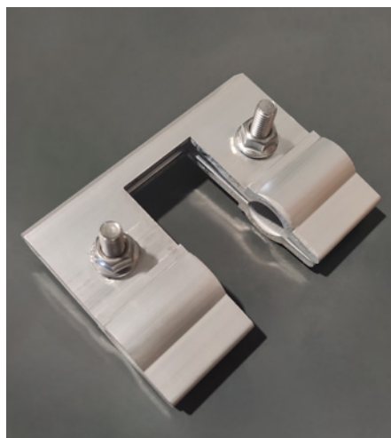
Schneefanghalter für Quadratrohr